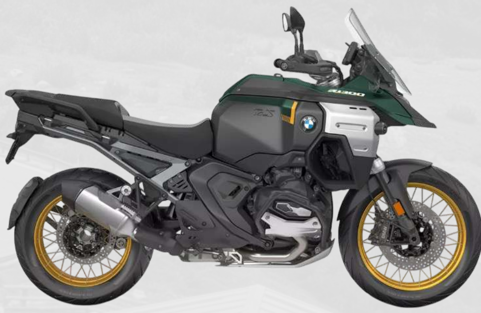
BMW R 1300 GS ADVENTURE Upgrade