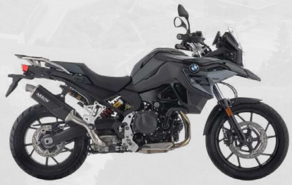
BMW F 800 GS Upgrade