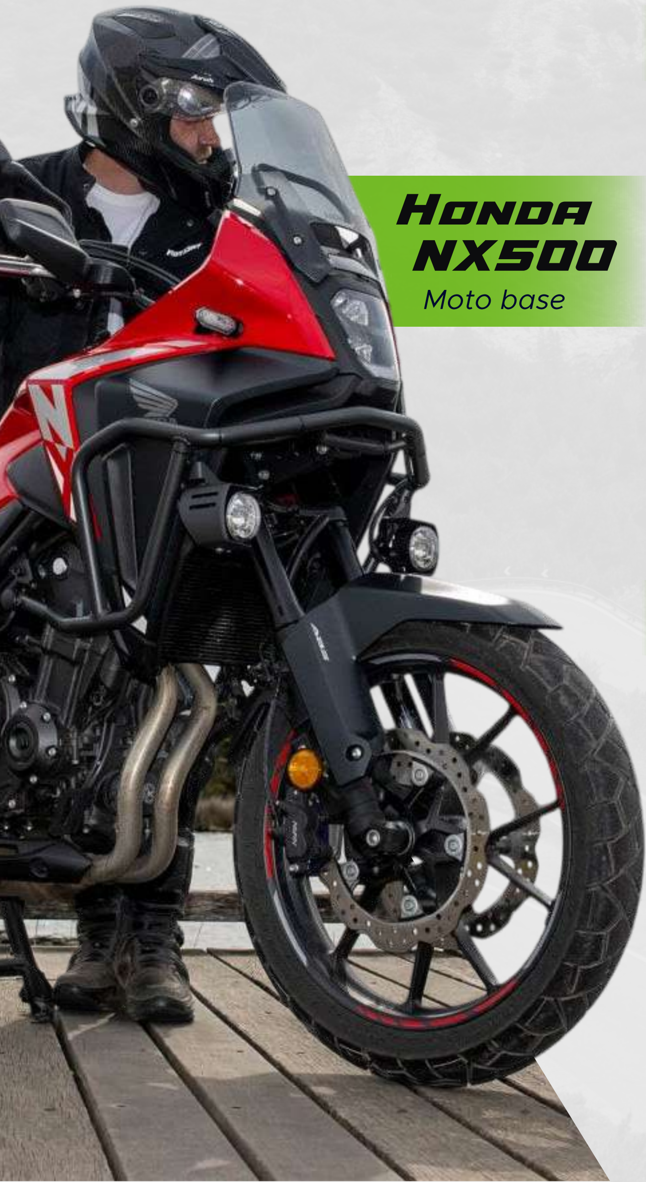
HONDA NX500 Moto base