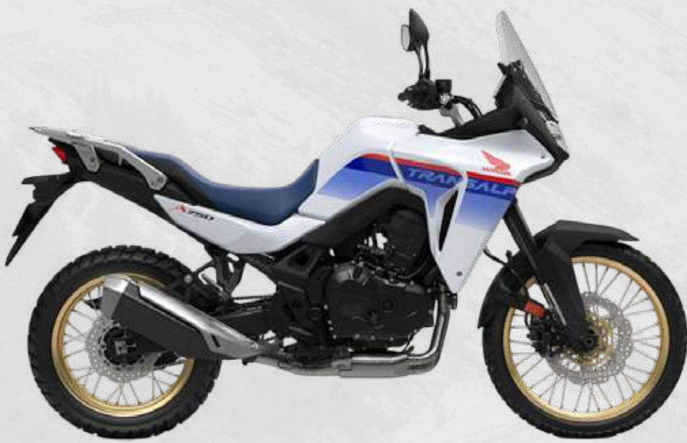
HONDA TRANSALP 750 Upgrade