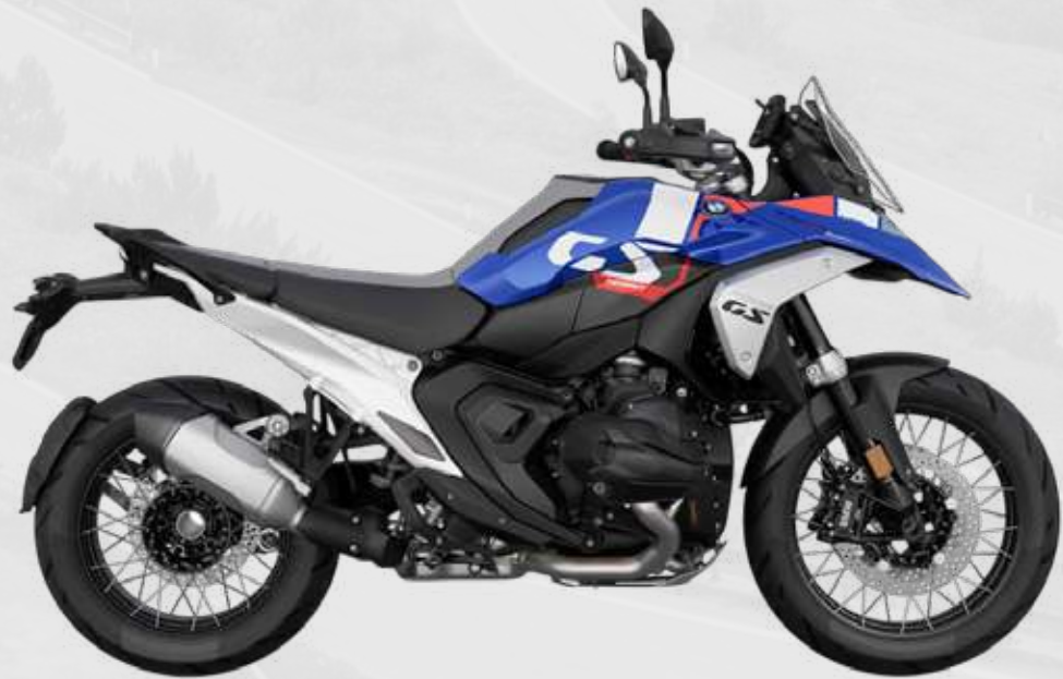
BMW R 1300 GS Upgrade