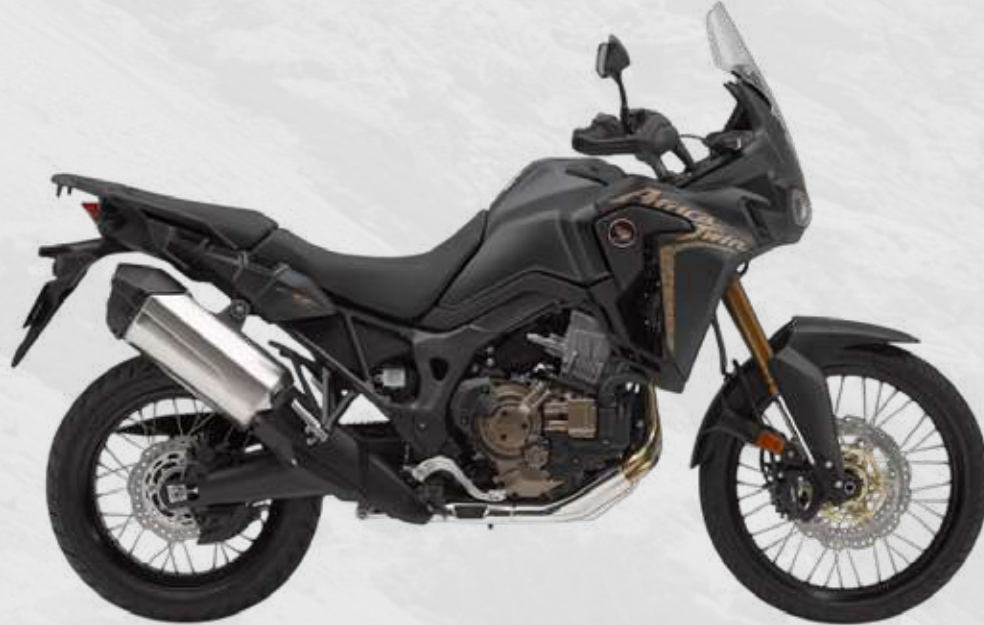
HONDA AFRICA TWIN 1100 Upgrade